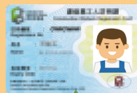
建造業工人註冊證

註：非指定人士可進行屬性質輕微的更改或修理工程。有關詳情及例子，請瀏覽水務署網頁： https://www.wsd.gov.hk/tc/plumbing-engineering/licensed-plumbers/works-of-a-minor-nature/index.html