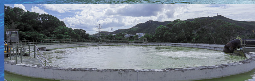
上水濾水廠 東江原水

此工程計劃是從西江水系引水至珠江三角洲東部地區，包括廣州南沙、深圳及東莞，提供新水源以舒緩這些地區對東江水的需求。工程在2023年底完成後，可提高東江水對港供水的保障能力。