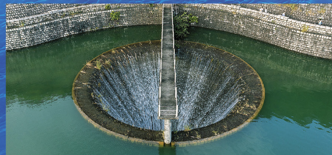
城門水塘的鐘形溢流口

香港的食水約70%至80%是來自東江水。將軍澳海水化淡廠第一階段於2023年年底啟用，最高食水產量為每日13萬5千立方米，佔本港食水用量約5%，主要是作為應對氣候變化導致集水量減少的補充水源。以目前情況而言，海水化淡暫時難以廣泛被採用以取代東江水。