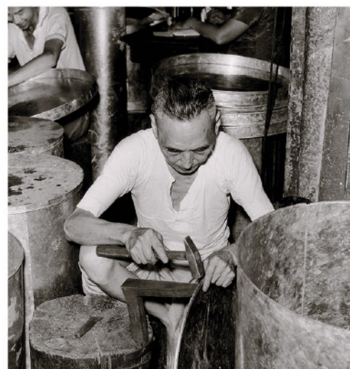
可盛載50加侖水的大鐵水桶銷量最佳