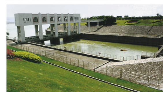
為減少東江水運送到香港途中受污染的機會，廣東省政府將東江取水口上移至水質較佳的地方，並興建由泵站、高架渡槽、隧道、水庫和專用涵管組成的輸水管系統，直接將東江原水輸送至深圳水庫。