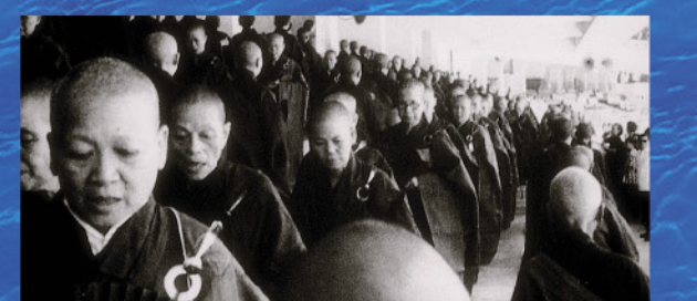
1963年天旱期間佛教聯會舉行祈雨法會