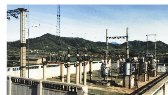
工程包括新建東江抽水站及加高深圳水庫大壩。