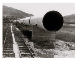
接收深圳水庫供水的大型水管，直徑約48吋。