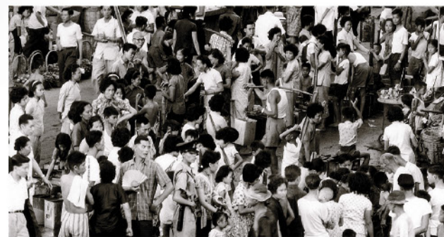
制水的日子，大批市民在街上輪候取水。