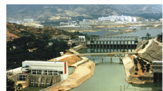
工程包括於東江、石馬、馬灘、竹塘、沙嶺等抽水站進行優化工程、擴建人工渠道及天然河道。