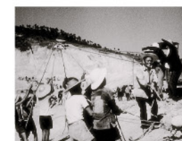
1964年2月，廣東省政府動用大量人力物力，在東江深圳沿線80多公里，展開了東深供水工程建設。

早在1960年香港正值經濟起飛，食水供應未能趕上工商業發展及人口增加帶來的需求。香港政府意識到單靠儲存天然雨水，並不能滿足急劇增長的食水需求，而向廣東省購買淡水，成為增加香港食水供應最便捷的途徑。