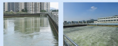
專用輸水管道 - 金湖渡槽 生物硝化站