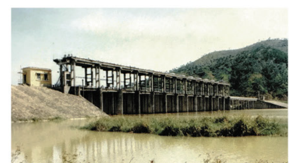
工程包括擴建供水河道、渠道及抽水站。