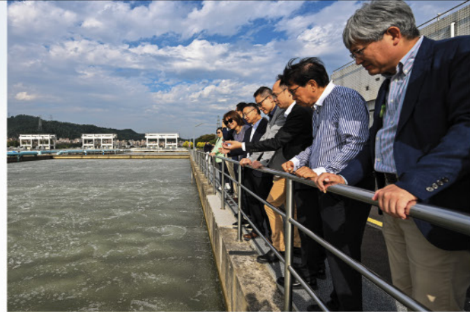
水務諮詢委員會於2023年11月到東江考察