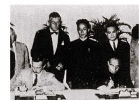
1960年11月15日，政府和廣東當局簽訂第一份供水協議。