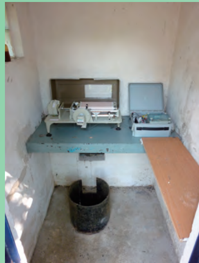
水文監測站小屋裡的設備：黑色圓柱型水井內的浮泡連接了圖中左上方的「測紙機」及右上方的「資料記錄器」，以記錄水位高度數據。

相信同事們都知道，甚至部分曾親身經歷過上世紀60年代因天旱而要實施制水的苦況。有鑑於此，部門成立了一個「水文小組」，並開發了一個能夠收集全港河流流量的數據庫，以更有系統的方式儲存及處理本地的水文數據，以期改善水資源發展方案，避免事件再次發生。