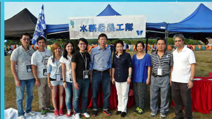
盲人觀星傷健營2013水務署義工隊成員。