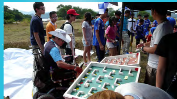
我們擺設了小遊戲與參加者互動，透過送出小禮物宣傳節約用水。

「盲人觀星傷健營2013」（下稱觀星營）是一個由社會福利署義務工作統籌課主辦的活動。大會希望藉著活動，進一步推廣社會共融的理念，共同建設一個和諧且美好的香港。