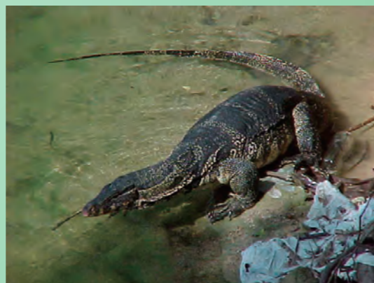
「水文組」的同事在前往水文監測站的途中有多次與巨型蜥蜴相遇。

水文監測站一般設置在河流的主要河道上，每個監測站可分成蓄水池及擺放儀器的兩間小屋。蓄水池一般會用混凝土建造，並於水池設置一個「三角堰」(V-Notch Weir)用作出水口(見右上圖)，目的是更有效地量度蓄水池的水位高度從而計算出河流的流量。當河水流經蓄水池的時候，池中的喉管會把部分河水引到旁邊小屋裡的一個水井，之後再利用井內浮泡的高度計算蓄水池的水位高度，並由此估算出河流的流量。擺放在小屋內的「資料記錄器」(data logger)和「測紙機」(chart recorder)會連接浮泡用以記錄水位高度數據(見左上圖)。「水文小組」的同事會定期親臨水文監測站收集數據，以對本地水資源的情況作出分析。這對部門在制訂水資源政策上有很大的幫助。