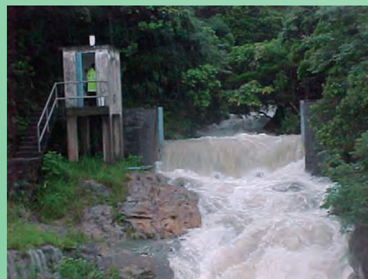
在暴雨過後，同事亦要前往水文監測站進行檢查和收集數據。

隨著科技轉變，水文監測站的設施亦不斷改良和更新。經過多年的演變，「水文小組」現時是由一位高級技術主任領導，並由三位技術主任、一位技工和一位一級工人支援。眼見幾位工作多年的老臣子即將相繼退休，近年「水文小組」已開始積極進行人事交接準備，希望在新梯隊接棒後，繼續為部門作出貢獻。