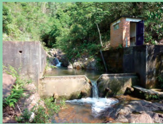
位於大欖涌水塘附近的水文監測站外貌。

「水文小組」成立的初期，其首要工作是在各個水塘的集水區，尋找具代表性的天然河流及引水道，並在該處建立水文監測站。另外，在籌劃興建「船灣淡水湖」及「萬宜水庫」期間，由於當地當時位處偏僻，「水文小組」的成員往往需要以徒步、坐船等方式前往現場作實地視察，或以直升機俯瞰地勢找出適合建立水文監測站的位置。現時由「水文小組」建立及管理的水文監測站可謂遍佈全港，例如接近港島大潭東的引水道；大嶼山深屈的河流；位處九龍塘與石硤尾以北的筆架山引水道和沙田小瀝源的河流等。此外，還有一些當年比較人煙稀少的鯽魚湖、涌尾、鶴藪、大欖涌的河流和城門的引水道等。另外，「水文小組」亦於多個主要水塘安裝量度水位高度的儀器，以更有效的方法計算水塘的溢流量。透過以上各個監測站形成了一個覆蓋全港的水文網絡。