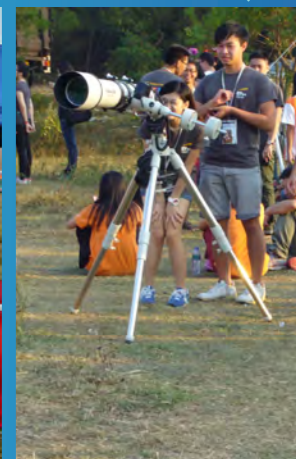
香港天文台代表擺設了望遠鏡供參加者觀察天象。