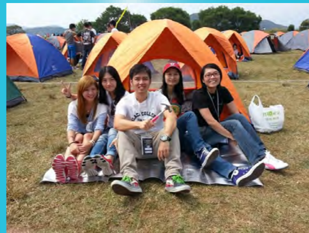
大會為參加者準備了營帳，十分週到。