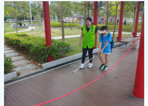
協助參與者體驗一下做視障人士的感覺