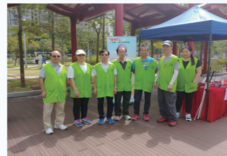
做導遊前先來一幅合照