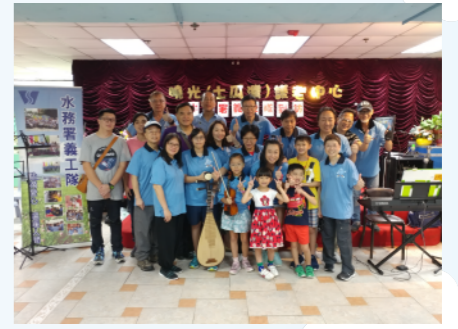
大小義工們演奏出悅耳的音樂，為一班老友記帶來歡樂