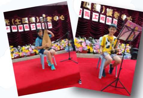
小義工們的中樂表演