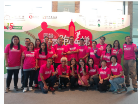
義工們鼎力支持是次活動