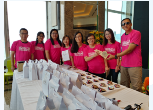
已準備好協助頒發各個獎項