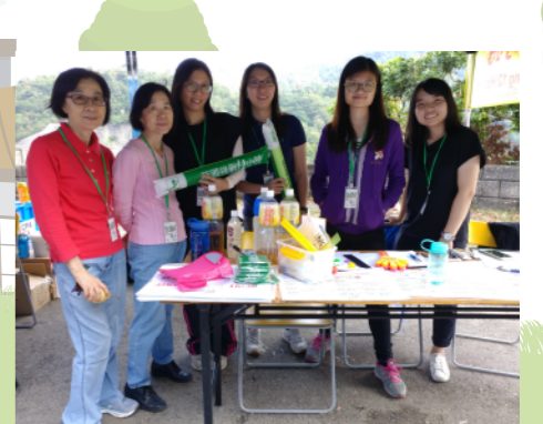
負責登記時間的義工