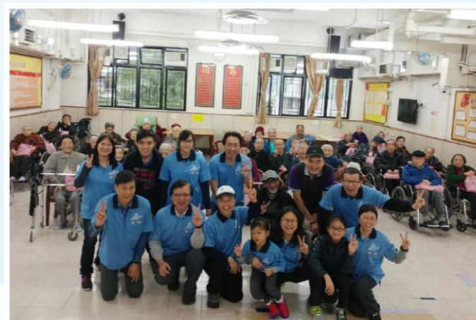
義工跟長者大合照