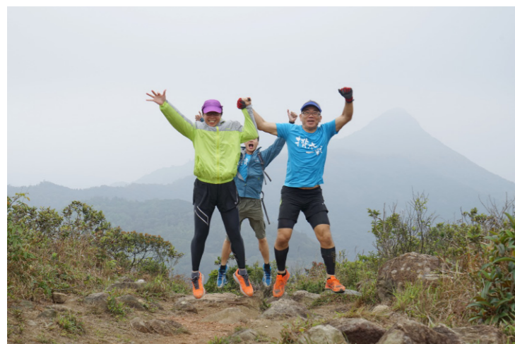
到達山頂，興奮無比。