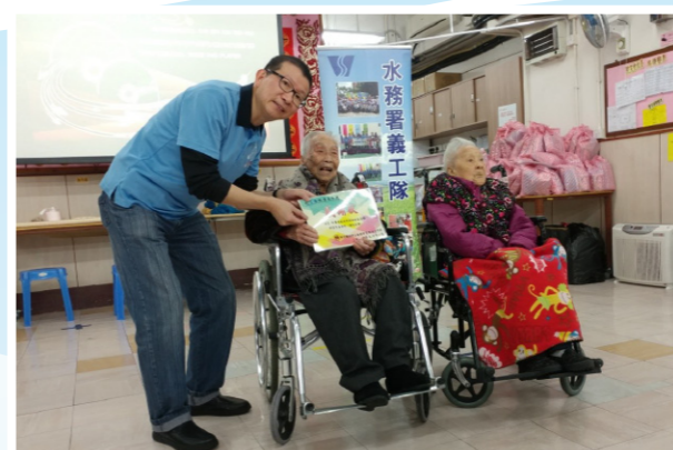
103歲的長者代表院舍致送感謝狀