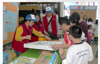
「水之迷宮」的攤位遊戲大受小朋友歡迎。