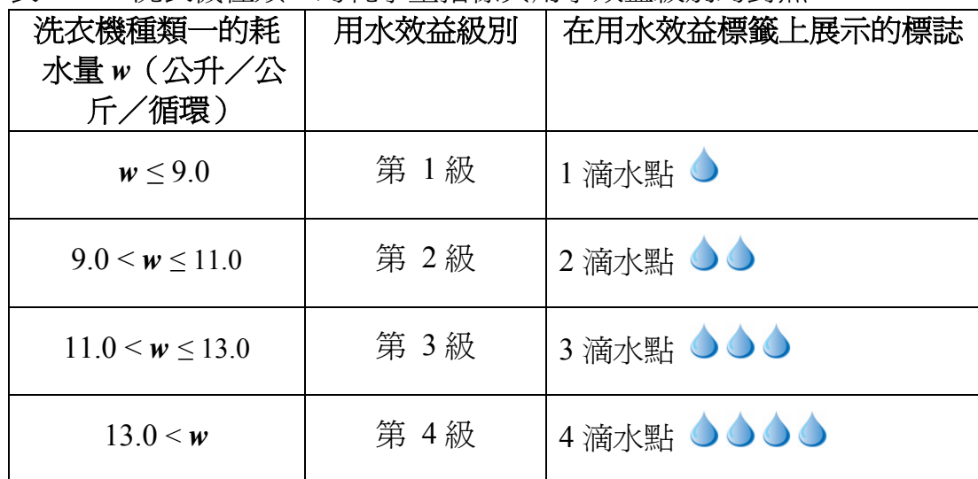
表三： 洗衣機種類二的耗水量指標與用水效益級別的對照